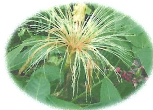
ต้นศุภโชค