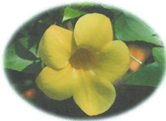
ดอกบานบุรี